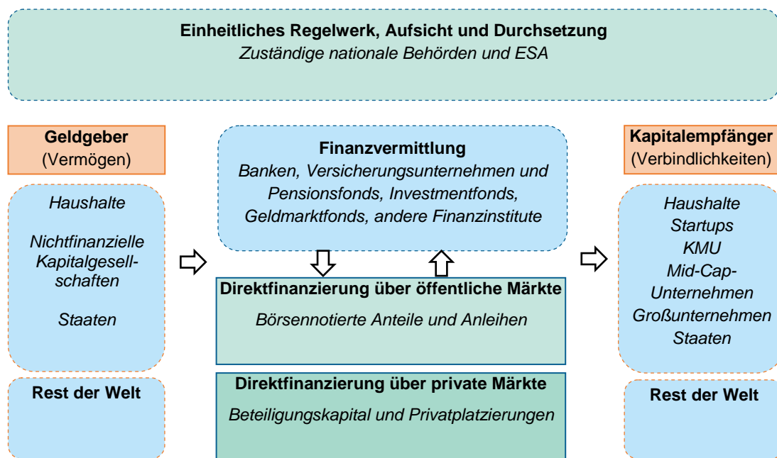
Abbildung 1: Schematischer Überblick über die Kapitalmärkte im Finanzsystem

In den letzten Jahrzehnten sind die Kapitalmärkte in der EU stark gewachsen. So stieg die Börsenkapitalisierung in der EU von 1,3 Billionen EUR im Jahr 1992 (22 % des BIP) bis Ende 2013 auf insgesamt rund 8,4 Billionen EUR (ca. 65 % des BIP) an. Die ausstehenden Schuldverschreibungen erreichten im Jahr 2013 einen Gesamtwert von über 22,3 Billionen EUR (171 % des BIP), im Vergleich zu 4,7 Billionen EUR (74 % des BIP) im Jahr 1992 3 .